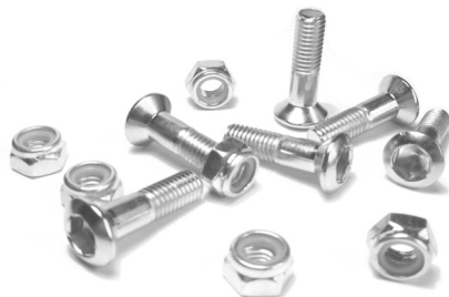
L35425 komplet śrub zębaki tylnej 29,50 zł