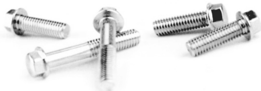
L35401 M6x12 szt. - 25 19 zł L35402 M6x16 szt. - 25 21 zł L35403 M6x20 szt. - 25 23 zł L35404 M6x25 szt. - 25 25 zł L35405 M6x30 szt. - 25 27 zł L35406 M6x35 szt. - 25 29 zł L35407 M6x40 szt. - 25 31 zł L35408 M6x45 szt. - 25 33 zł