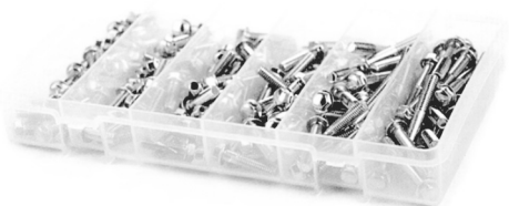
L35400A pudełko śrub (6 przegródek) M6x12/16/20/25/30/35/40 po 25 sztuk z rodzaju 119 zł