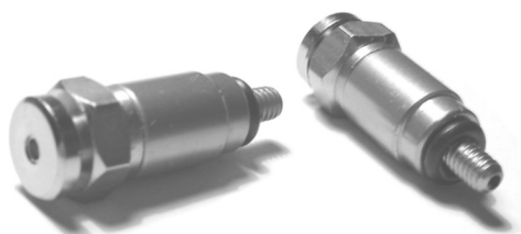
L35736 KTM, Husqvarna (gwint M4) cena za kpl. 59 zł L35737 Kayaba, Showa (gwint M5) cena za kpl. 59 zł

Rewelacyjne urządzenie pozwalające jednym naciśnięciem na spuszczenie powietrza z amortyzatorów; (dłuższa jazda powoduje samoczynne pojawienie się powietrza w amortyzatorach, co pociąga za sobą utwardzenie amortyzatora). Wykonane ze stali nierdzewnej